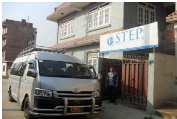
Den hyrda minibussen utanför barnhemmet.

Förra året under detta skollov var ju barnen på sin allra, första semester någonsin! De paddlade då kanot, var på dansföreställning, badade med elefanter, red på elefanter etc. I år var det dags för en ny semester! Minibuss var hyrd och de åkte iväg på en liten tvådagarsresa och bodde en natt på hotell.