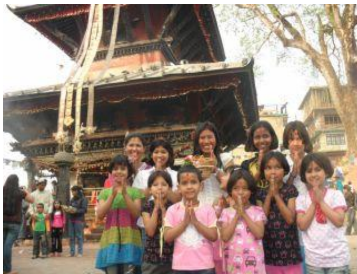
Barnen säger Namaste utanför ett tempel vid Manakamana.