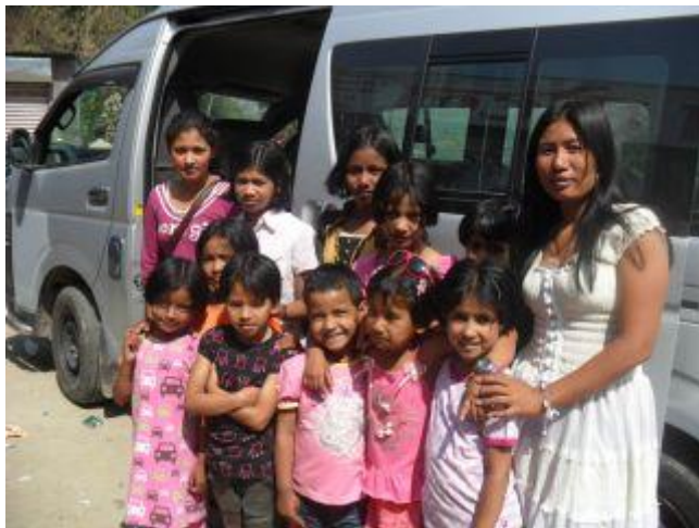
Alla utanför bussen

Första dagen tillbringade de vid Manakamana, som är ett av de allra heligaste hindutemplen i hela världen. Det ligger högt upp på ett berg (eller kulle, som de kallar det för i Nepal) några timmar från Kathmandu på väg upp mot Himalaya. Man åker cable car upp till själva templet och där är alltid full aktivitet och massvis med människor! Ett väldigt intressant ställe.