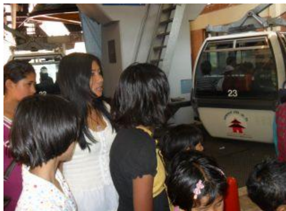
På väg in i en cable car