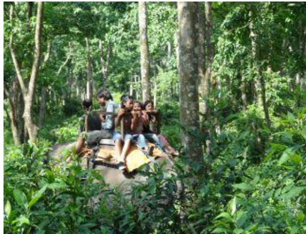
Elefantridning i djungeln.