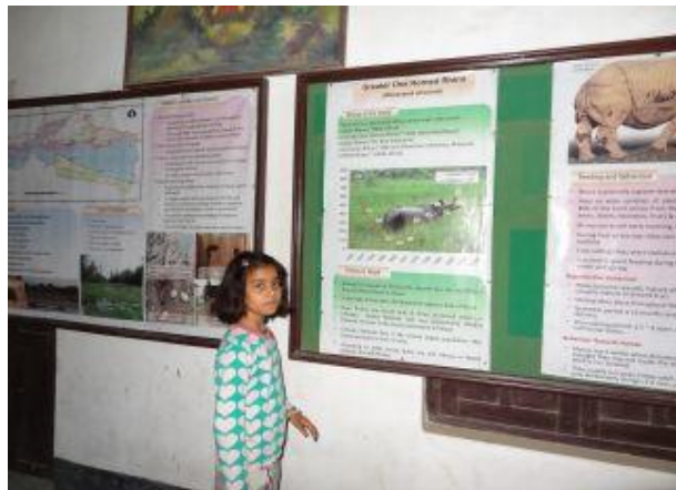
På muséet om nationalparken.

Fler bilder från deras resa finns på hemsidan under ”Galleri 2012 ”