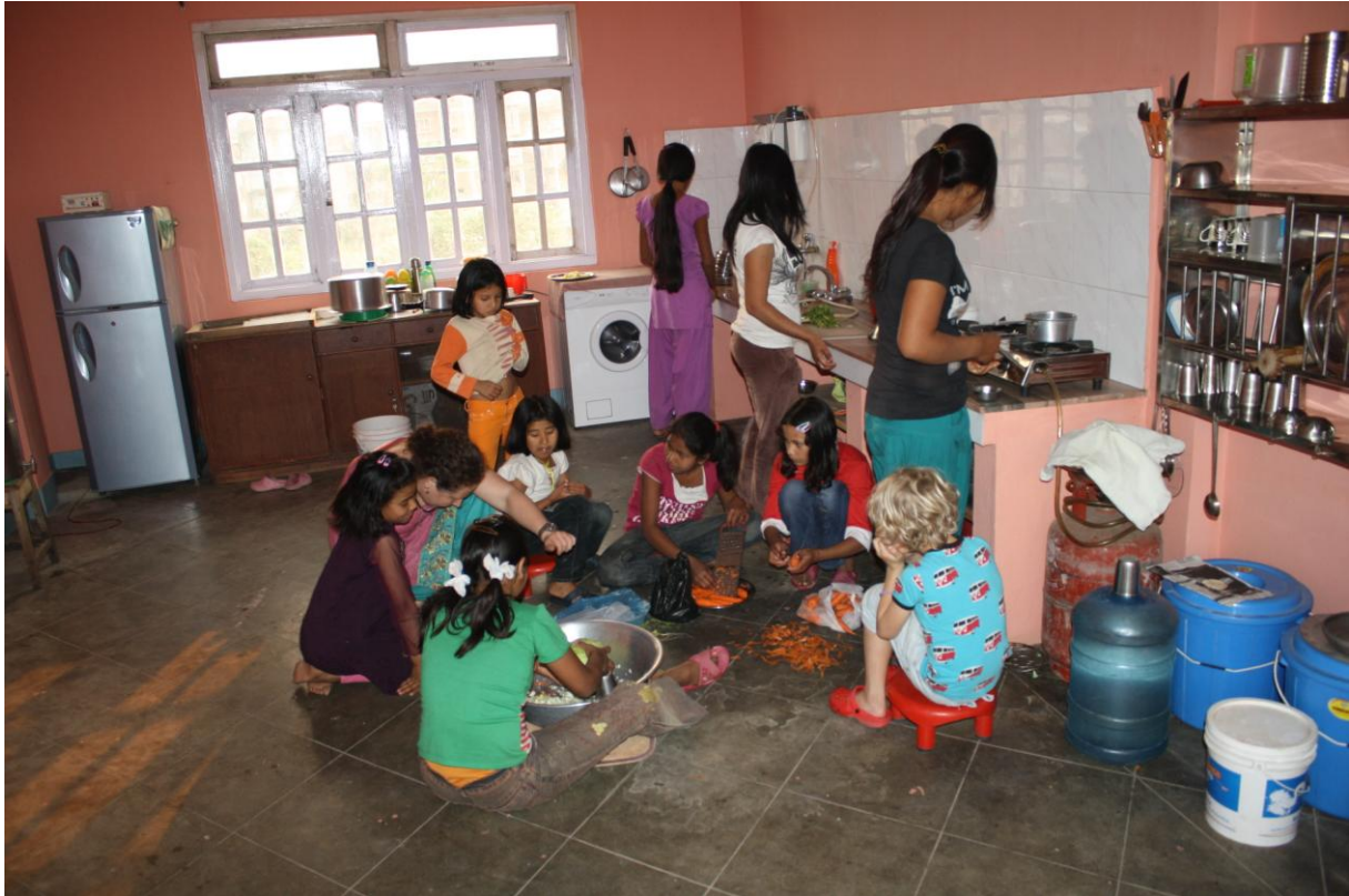
Bilder på det köket

Deras lite längre skollov började några dagar innan vi åkte hem i början av april, så då hade vi några hela långa dagar tillsammans. Då passade vi bl a på att byta köksrum. Tidigare låg köket på den nedre våningen av de två våningar vi hyr jämte de två sovrummen och lekrummet. Nu har vi fått tillgång till ytterligare ett stort rum på övervåningen och dit flyttade vi köket. Alla hjälptes åt med att bära grejer och möblera det nya köket. Det gamla köket kommer nu att bli ett "study room", som nu har målats om och snart skall inredas med små, låga bänkar som skall stå på golvet, som de kan ha böckerna på när de sitter på golvet och studerar. I det köket kommer vi att ha ett lågt "köksbord", som skall stå på golvet, som tallrikarna kan stå på när de sitter på golvet och äter. Rajeev har i dagarna varit hos en finsnickare och måttbeställt två bord.