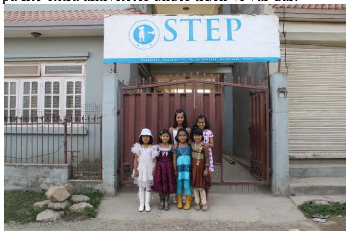
Utanför The Step.

Barnen var ganska upptagna med att plugga inför sina "final exams" som pågick under några dagar när vi var där, men å andra sidan hade de ganska korta skoldagar eftersom de endast skrev sina prov och inte hade vanlig undervisning, så det fanns ändå mycket tid att hitta på olika saker tillsammans med dem. Vi var på olika utflykter ihop, var på restaurangbesök tillsammans, besökte deras skola och träffade rektorn, cyklade, idrottade, spelade spel och lekte lekar etc tillsammans. Vi var till stor del med dem i deras vardag, men vi hittade också på lite extra aktiviteter under tiden vi var där.