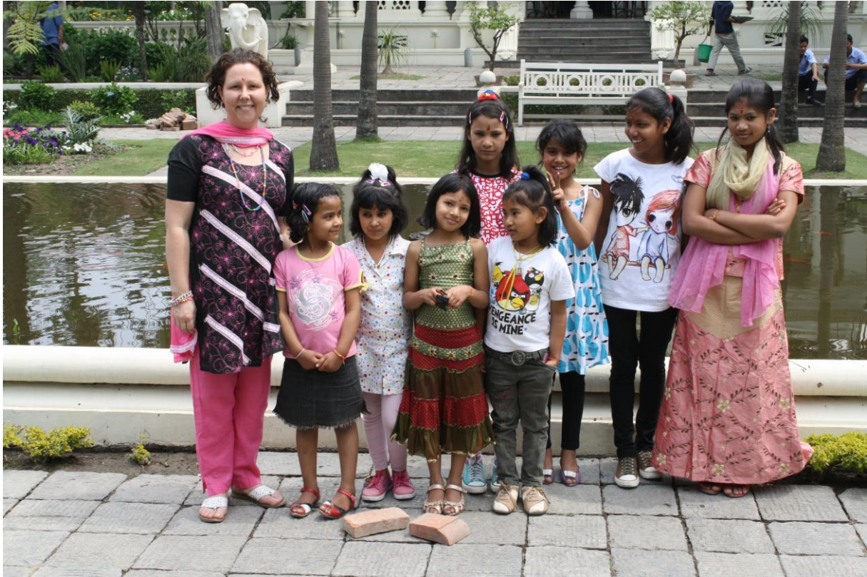
Jag och tjejerna på utflykt i en ny, vacker park inne i centrala Kathmandu.