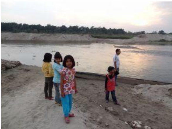
Solnedgång vid flodbädden.