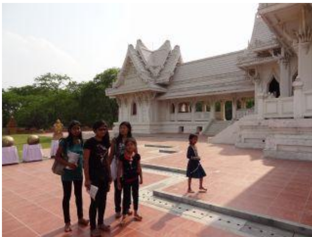
Utanför ”World Peace Pagoda”.