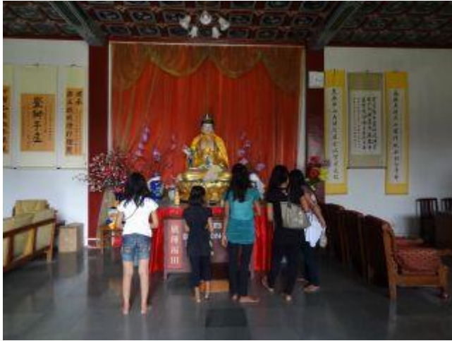
Inne i ett av alla kloster.