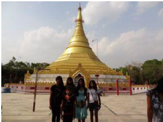
Framför "Great Lotus Stupa".

Buddha föddes här i Lumbini 623 år före Kristus och idag är det ett viktigt pilgrimsmål för buddhister från hela världen. Det finns många olika stupor och många olika kloster i detta område och de var fullt sysselsatta i tre hela dagar med att besöka så många kloster och stupor som möjligt. De bodde på fint hotell och åt god mat varenda dag!