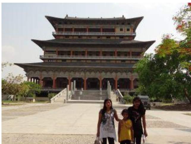
Utanför ett stort kloster.