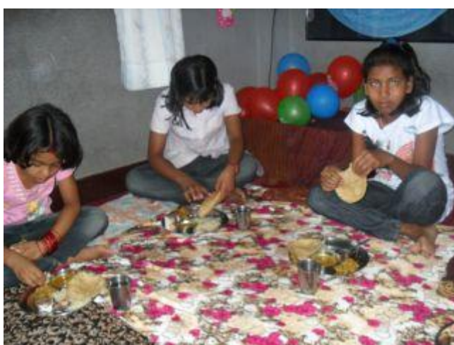
Födelsedagsmiddag med ballonger bakom.