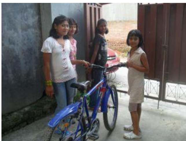
genom grinden med cykeln.