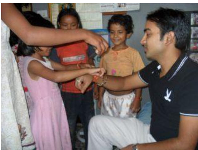
Barnen ger Bhiki armband.