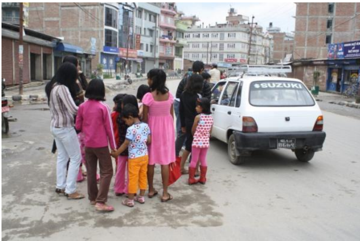
Väntan på taxi.