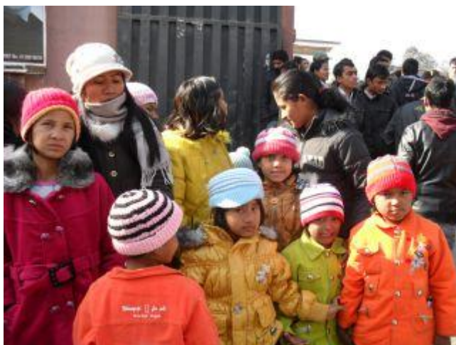
På väg till bion.

De var på bio för någon vecka sedan och det var uppskattat. Efter att den nepalesiska filmen var slut, gick de på restaurant och åt tibetansk mat.