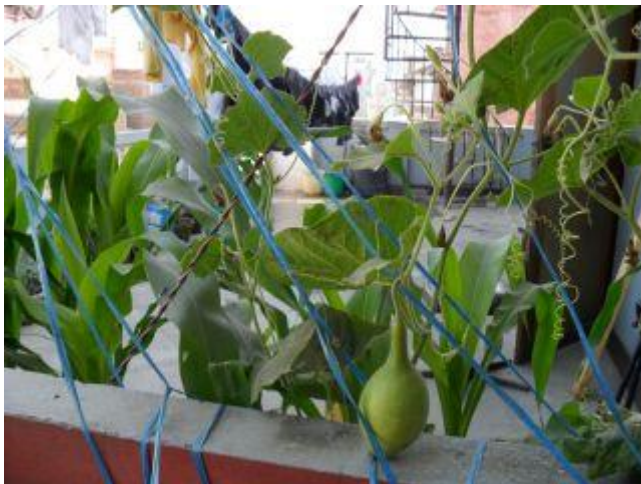
Grönsaker som de har börjat odla på takterassen och som de sedan tillagar.

Vi vill tacka resebyrån Tur & Retur i Helsingborg för deras bidrag till barnhemmet.