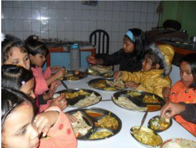
Traditionell nepalesisk mat.