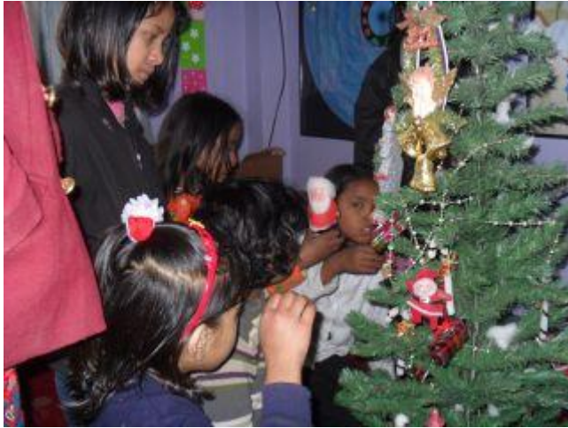
Alla hjälps åt med att klä granen.