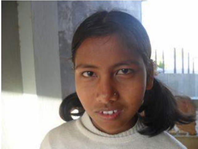
Ett alldeles nytaget foto.