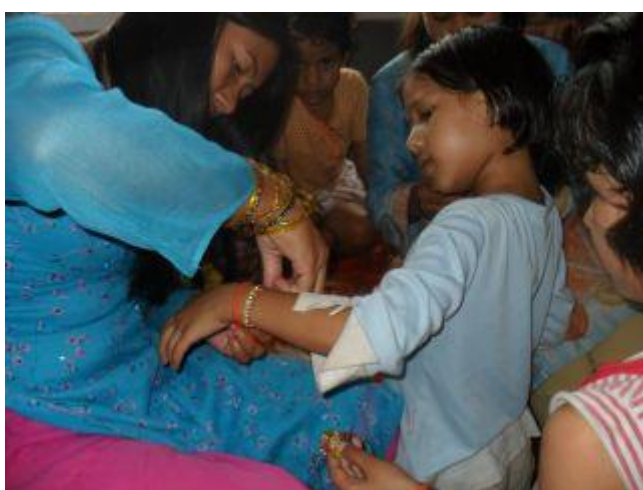
Neru under en festival hösten 2011.