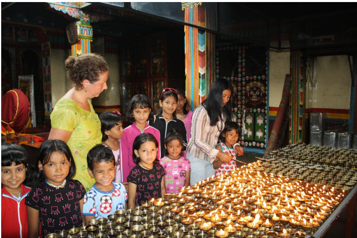
Vi tänder oljeljus inne i ett buddistiskt kloster

Vi var också på en heldagsutflykt till ett viktigt buddistiskt tempelområde i Kathmandudalen; Swyambudnath. Barnen var väldigt förnadsfulla och var riktigt duktiga på alla olika ritualer man skulle göra vid olika ställen på området. Jag har varit vid detta tempel väldigt många gånger förut, men det var egentligen först nu som jag verkligen fick se vad man gör här. Det var en toppendag som avslutades med tibetanska momos på en pytteliten tibetansk restaurang i området.