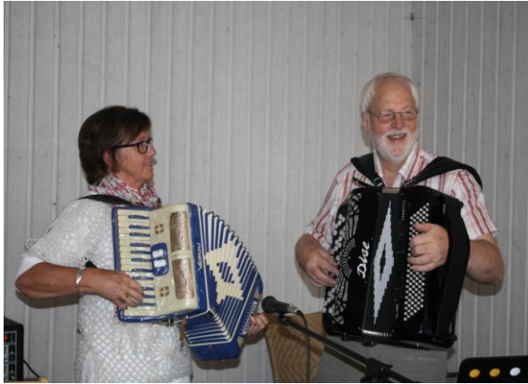
Bilder från allsångskvällen