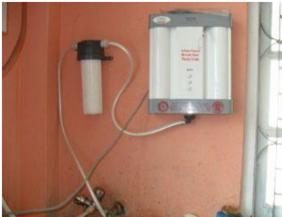
Bild på vattenreningsapparaten och när den installerades.