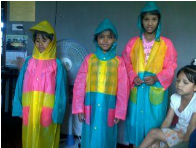
Barnen har fått nya regnkläder och stövlar

Vi har köpt en cykel till barnhemmet, som alla barnen nu lär sig att cykla på. Tyvärr har vi ännu inte fått några bilder på detta, men det kommer snart.