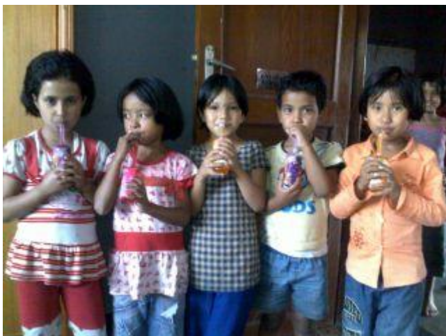
Barnen dricker var sin läsk.