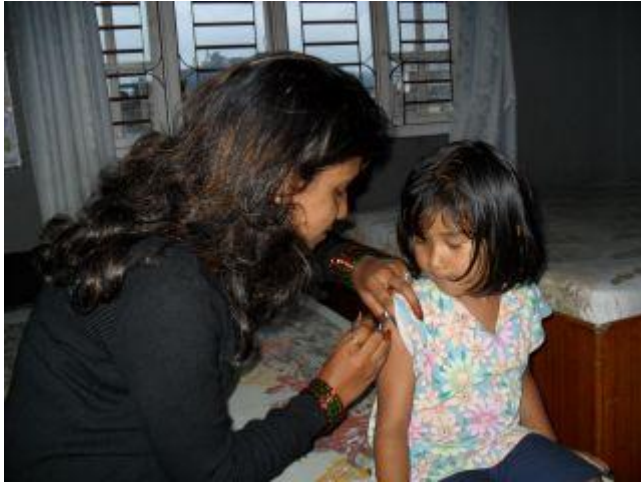
Vaccinationsspruta för Guddu sommar