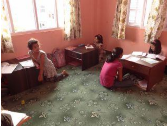
Nyinrett ”study room” i det gamla köket.