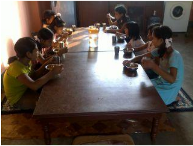
De sitter på tjocka mattor vid de låga borden.

Vi har även haft en finsnickare som har tillverkat ett traditionellt matbord, som barnen nu kan sitta vid när de äter. Om de vill - de får gärna fortsätta sitta på golvet som vanligt och fortsätta ha tallriken och glaset på golvet. Nu finns i alla fall möjligheten att fortsätta sitta på golvet, men att ha tallriken på ett lågt, traditionellt, nepalesiskt bord.