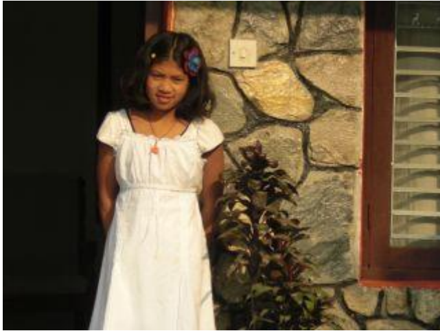
Nepal, april 2010.