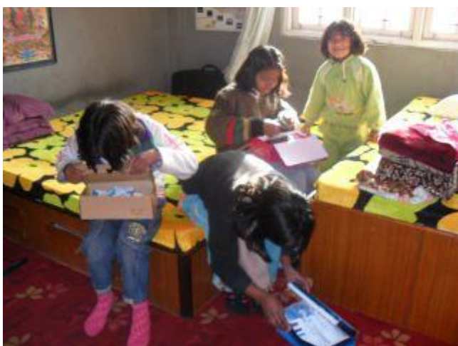
Barnen sitter på sina sängar i sovrummet och tittar på sina nya skor som fortfarande ligger i kartonger.

Under mars månad har barnen firat den stora högtiden Holi där man kastar röd färg och vatten på varandra. Det är en riktig folkfest; alla är ute på gatorna och kastar på varandra. Förra året tog Rajeev bilder på när barnen låg uppe på terrassen och kastade färg och vatten på förbipasserande på gatan nedanför. Detta år var de istället ute på gatorna bland folk och Rajeev tog därför inte med sin kameran, eftersom den lätt kan bli förstörd av vatten och färg. Rajeev berättar dock att barnen hade ännu roligare i år nu när de verkligen var med bland andra människor och kastade hej vilt på varandra och andra! De flesta nepaleser tycker denna högtid är årets roligaste och det verkar Step-barn också tycka.