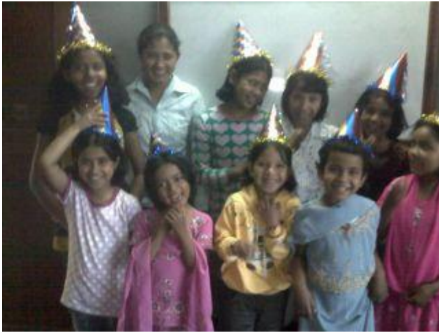
Alla samlade med festhattar på sig.