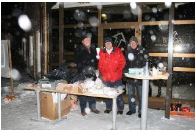
Bild från bildspelet på flickorna utanför

Tre Rotarymedlemmar som trotsade snöovädret.