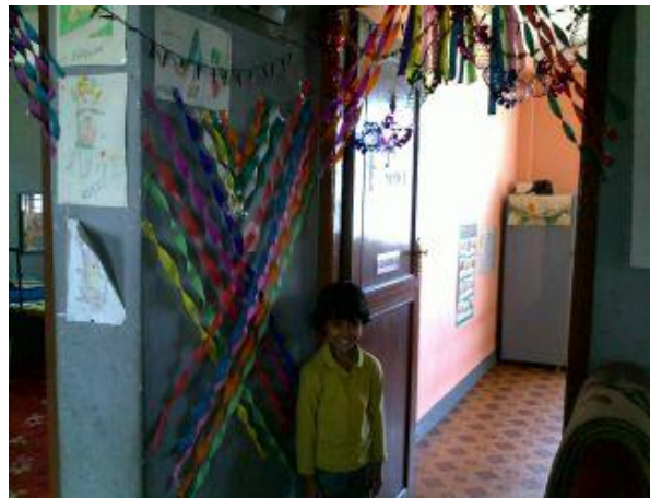
Susma utanför köket