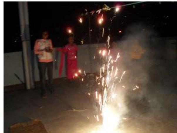
Fyrverkerier på takterrassen

På juls skyltningen i Bredaryd vid första advent sålde Finnvedens Rotaryklubb för tredje året i rad bröd, charkuteriprodukter, kakor och grytlappar till förmån för The Step. De visade också bilder från barnhemmet på en stor duk utomhus. Brödet skänktes av Bäckhästens Bageri i Unnaryd samt Bredaryds Vårdshus i Bredaryd. Charkuterierna skänktes av Ello charkuterier i Lammhult och kakorna, en del bröd och grytlapparna skänktes av Rotarymedlemmar. Det var en väldigt trevlig eftermiddag och vi är väldigt tacksamma och glada för klubbens fina engagemang!