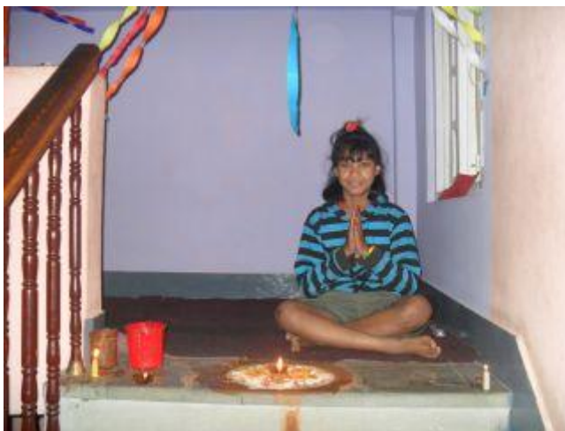
till vänster bakom muren.