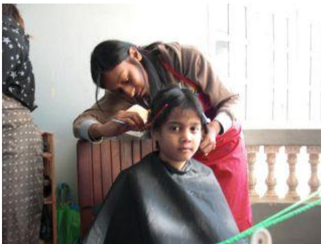
Rista när frisören kom till Step.