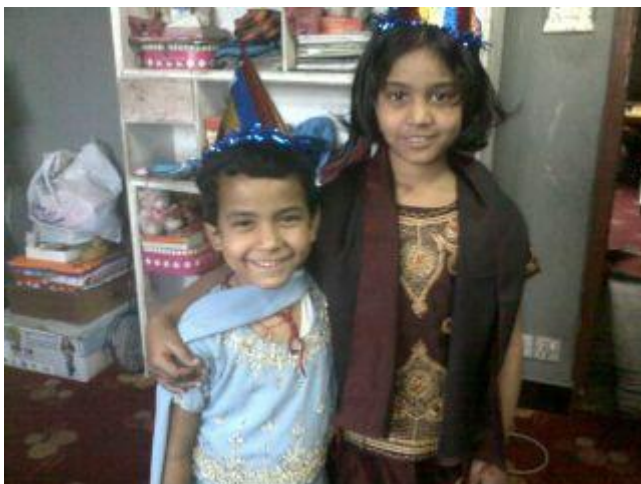
(skjorta och byxor) på ett kalas.