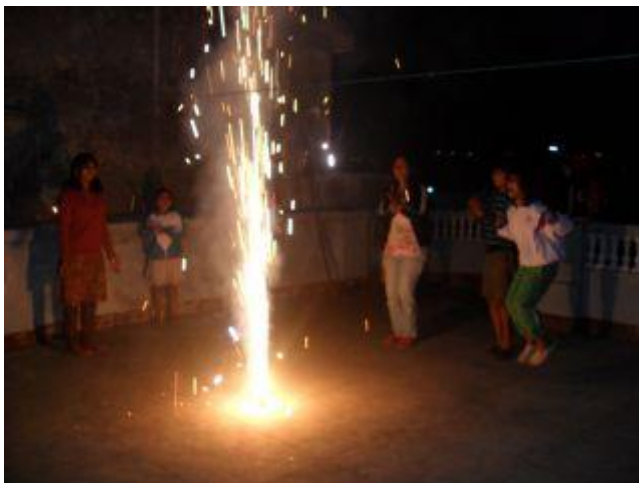
Fyrverkerier på terassen.