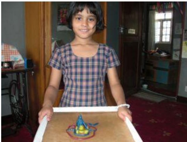
Rista med modellera