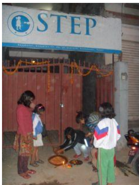
Förberedelser med offergåvor och lyktor utanför Step.

Tihar, ljusets festival, har firats under denna månad. Det är en riktigt mysig högtid och man tänder massa ljus och lyktor samt skjuter fyrverkerier.