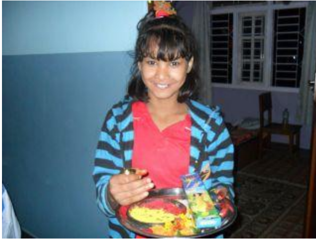
Mina med Tihar-tillbehör; rökelse etc.