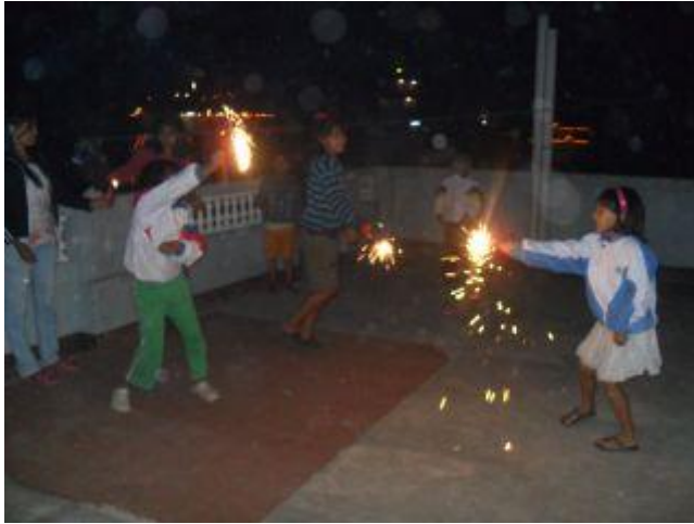
Alla barn älskar Tihar; här med ”tomtebloss”

En ledig lördag åkte hela barnhemmet till Dakhsinkali, ett väldigt heligt hinduiskt tempel, där man tillber och dyrkar Gudinnan Kali. Gudinnan Kali är ”The Goddess of Destruction” och hon kräver blod för att må bra och för att inte orsaka katastrofer. Så vid Dakhsinkali tempel offras det därför kycklingar, getter och andra djur. Blodet flödar på detta tempelområde och det är en ganska annorlunda upplevelser att vara där, får man nog lova att säga. För vegetarianer, som ju våra barn är, går det dock lite annorlunda tillväga. Eftersom man helst skall äta det man har offrat, kan man ju inte offra djur. Vad man då gör, är att man istället offrar kokosnötter. När man krossar kokosnöten, skall kokossaften påminna om blod som skvätter och på så sätt går det bra att äta det man offrat. Enligt vegetarianerna, godtar Gudinnan Kali detta, och hon hålls på gott humör. Flickorna offrade därför kokosnötter och tyckte att det var fantastiskt att för första gången åka till detta stora tempel några timmar söder om Kathmandu. Ingen av dem hade varit där innan och eftersom det är ett viktigt tempel, var det en stor dag för dem alla.