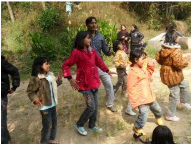
Ett litet dansstopp på väg till templet.