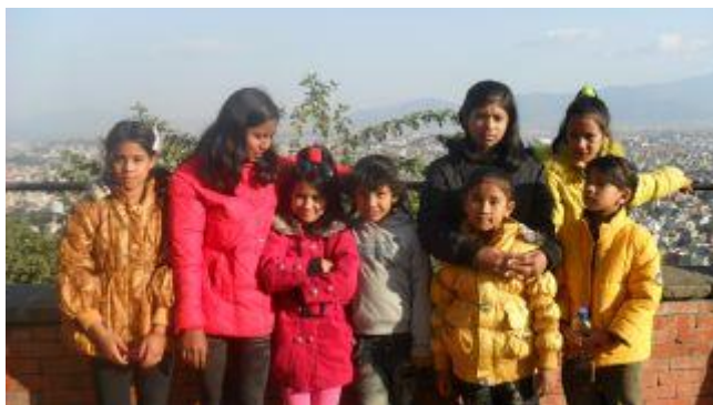
Kathmandu som utsikt bakom.

I söndags var alla barnen på utflykt till Swayamboudnath, ett stort och viktigt tempel inne i centrala Kathmandu, som barnen går till ganska ofta.