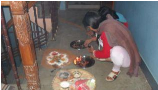
Neru förbereder alla offergåvor.