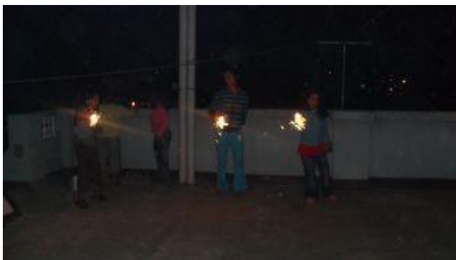
Under Tihar tändes man raketer och tomtebloss.