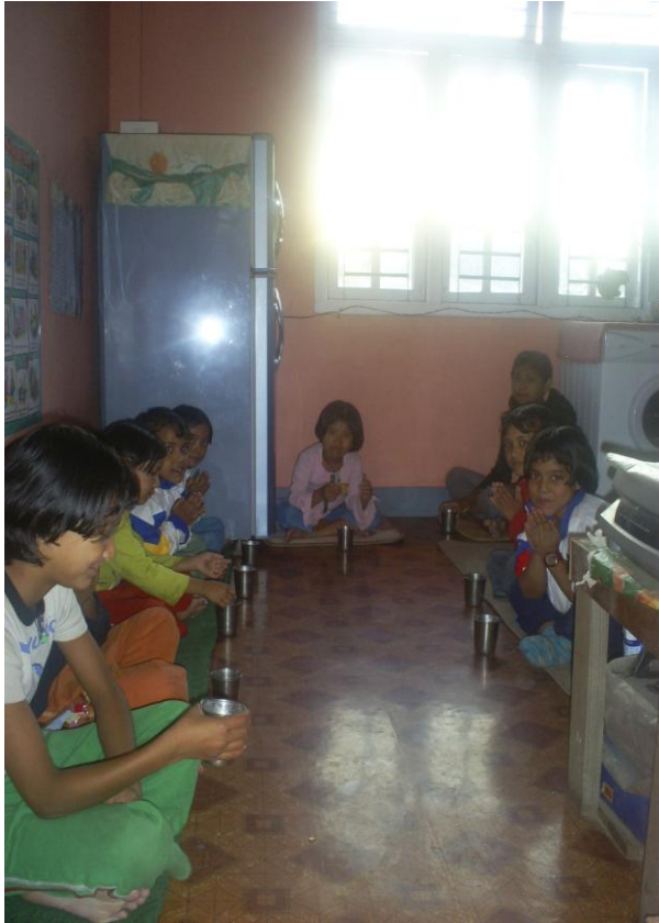
Barnen brukar dricka varm mjölk så fort de har kommit hem från skolan. I bakgrunden ser man vårt nya kylskåp.