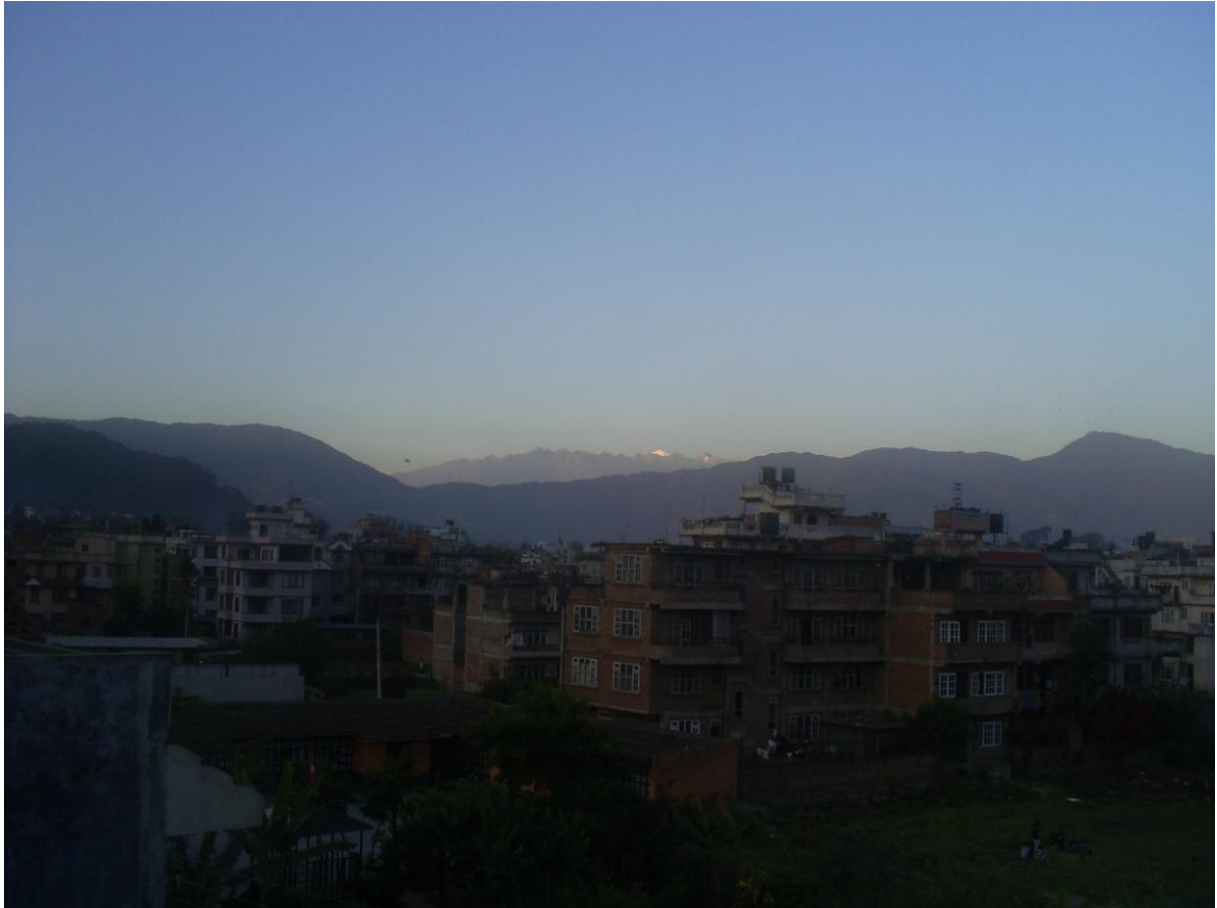
Utsikten från barnhemmets takterass; man skymtar en vit Himalayatopp allra längst bort.

Avslutningsvis, kan vi berätta att hemsidan har fått många nya bilder under fliken ”flickorna”, där varje barn presenteras.