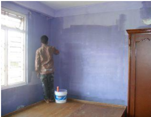
Ett rum blev ljusblått.

Hela barnhemmet har målats om och flickorna valde själva de nya färgerna som är olika för varje rum.