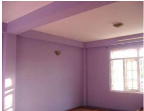
Ett annat lila. De andra blev aprikost och rosa.