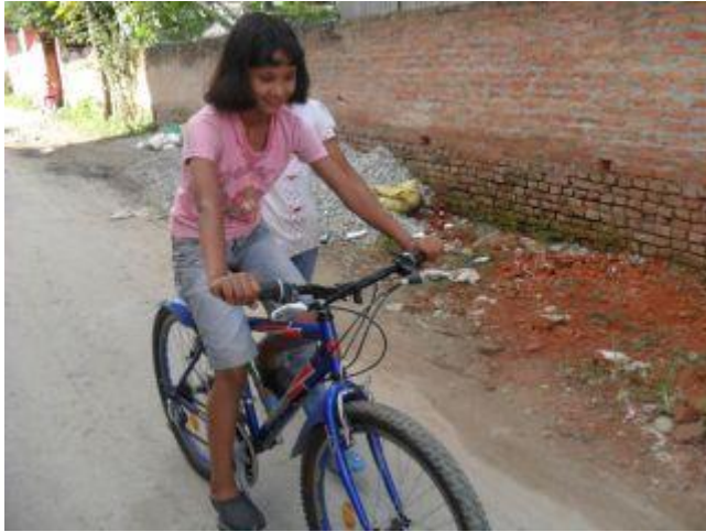
Mina har lärt sig cykla.