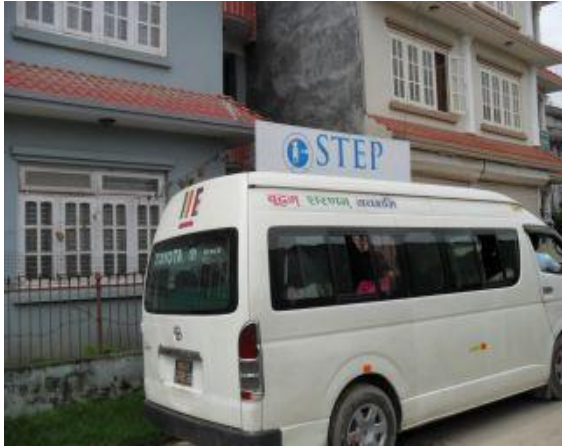
Bussen de åkte med.