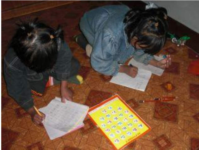
De började i skolan i januari 2009 och började direkt träna på bokstäver.