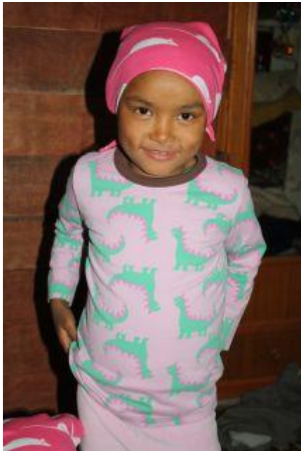
Srijana hösten 2009.