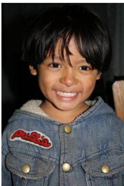
Samjhana våren 2009.