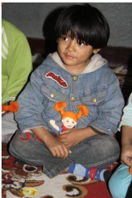
Samjhana hösten 2009.