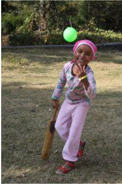
Srijana hösten 2009.