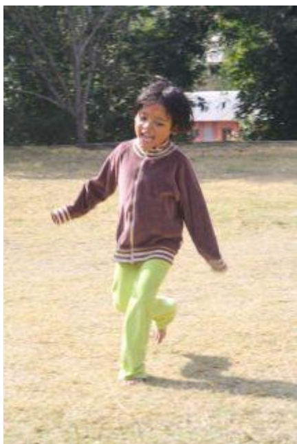
Samjhana hösten 2009