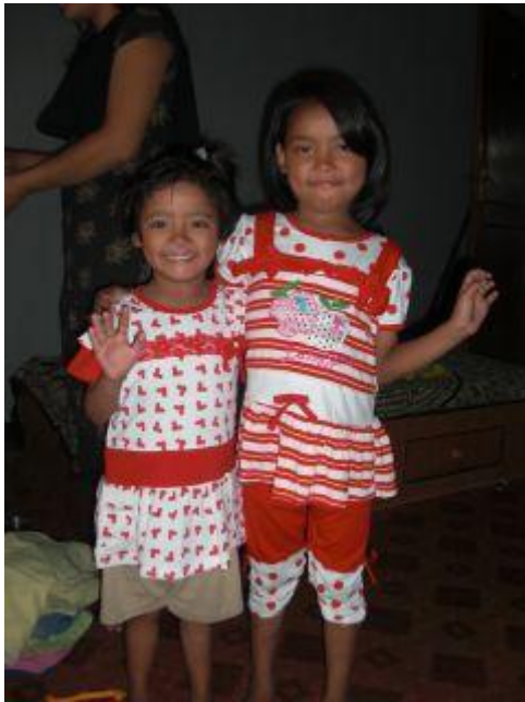
De båda systerarna sommaren 2009.