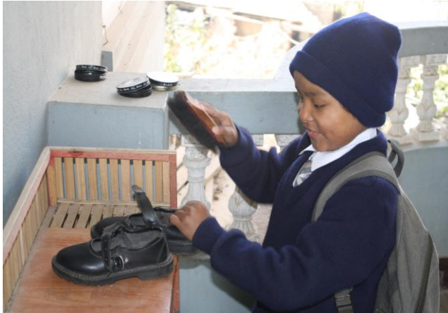
till skolan, hösten 2009.