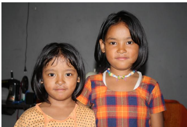
Systrarna sommaren 2010.