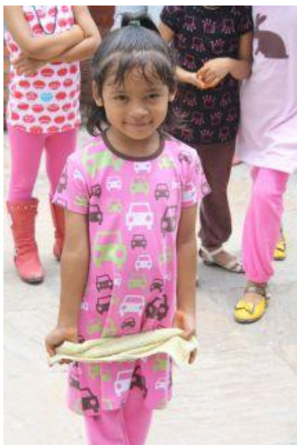
Samjhana sommaren 2010.