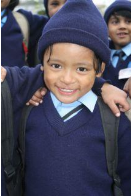
Samjhana vinter 2010.